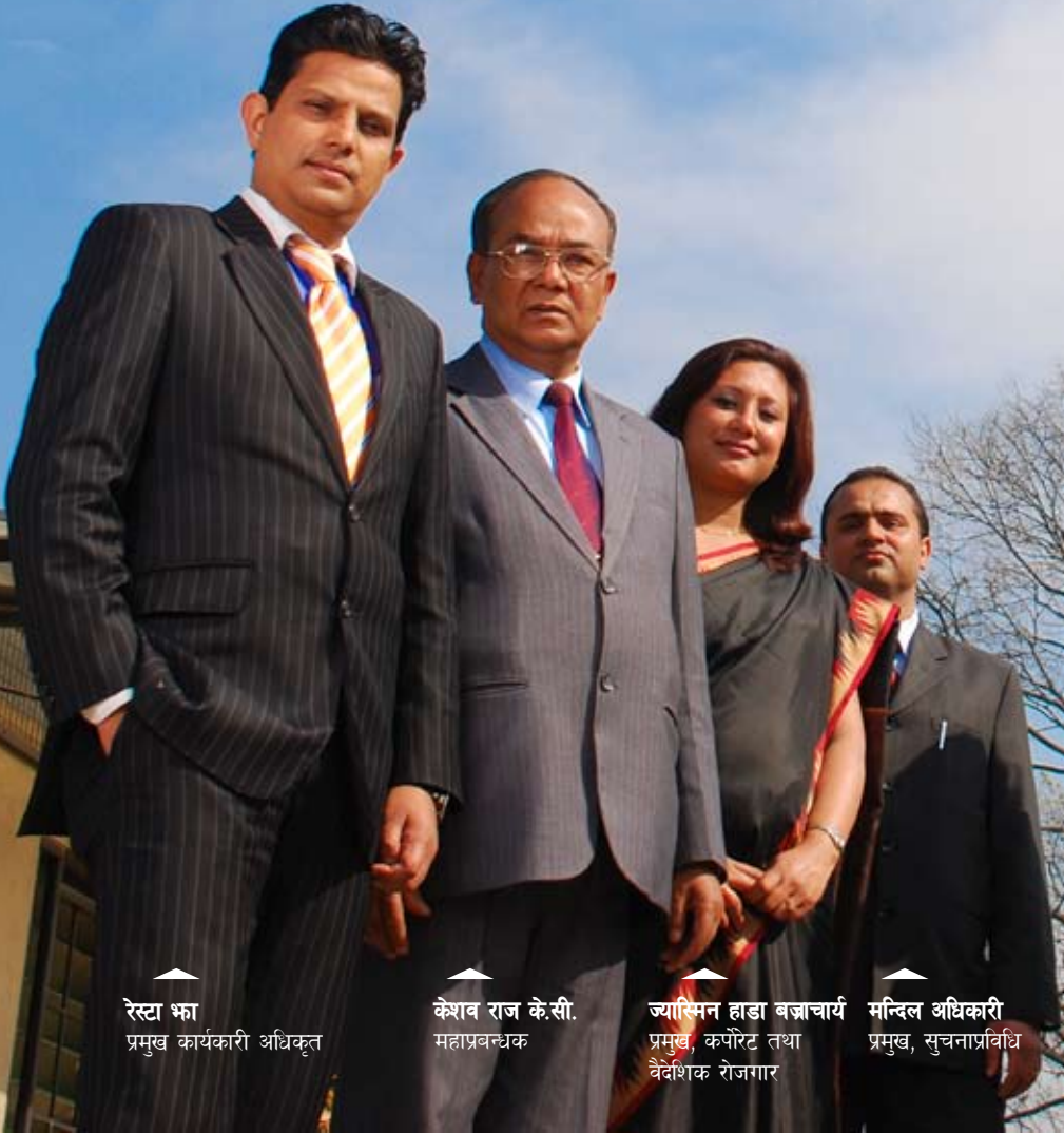
रेस्टा भ्ना प्रमुख कार्यकारी अधिकृत